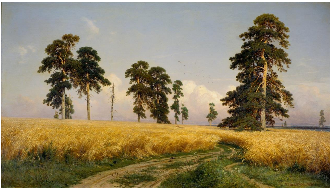
И. Шишкин «Рожь»

Проанализировать произведение по следующим параметрам: